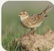
Alouette des champs. Neil Smith

Espèces des milieux ouverts, plaines, steppes, marais et prairies. Souvent associées et très sensibles aux pratiques agricoles.