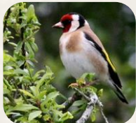
Chardonneret élégant, Ken Billington

Dans les haies, arbres isolés, bois, forêts, roselières, ou encore cheminées et pylônes