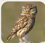
Chouette chevêche, Trebal - a

Dans les falaises, zones rocheuses, arbres creux, habitations, berges abruptes nues, etc.