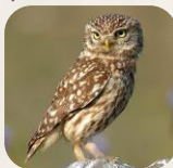
Chouette chevêche, Trebal - a

Dans les falaises, zones rocheuses, arbres creux, habitations, berges abruptes nues, etc.