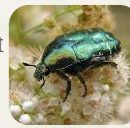
Cétone dorée.

[cltic-info] blog « Sauvages du Poitou »