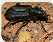
Carabe sp.

Ex : Cicindèles , staphylin , carabes , bousiers , etc.