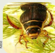
Dytique magné.