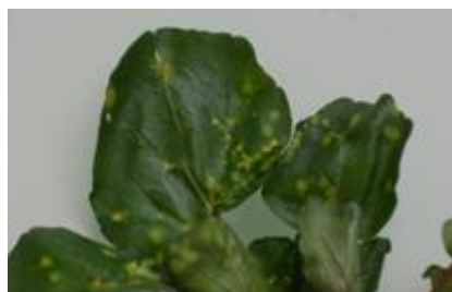
Symptômes de la maladie de la tache jaune (Fredon IDF)