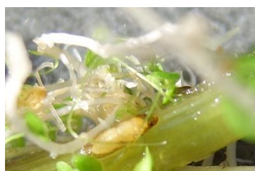
Pupes de la mouche du cresson (Fredon IDF)

Des pupes de la mouche du cresson sont toujours observées sur deux des cinq sites contre quatre lors du dernier relevé, il y a 15 jours. La pression est également en diminution puisque seulement 5 et 15% des pieds présentent des pupes à Saint Hilaire et Moigny sur Ecole.