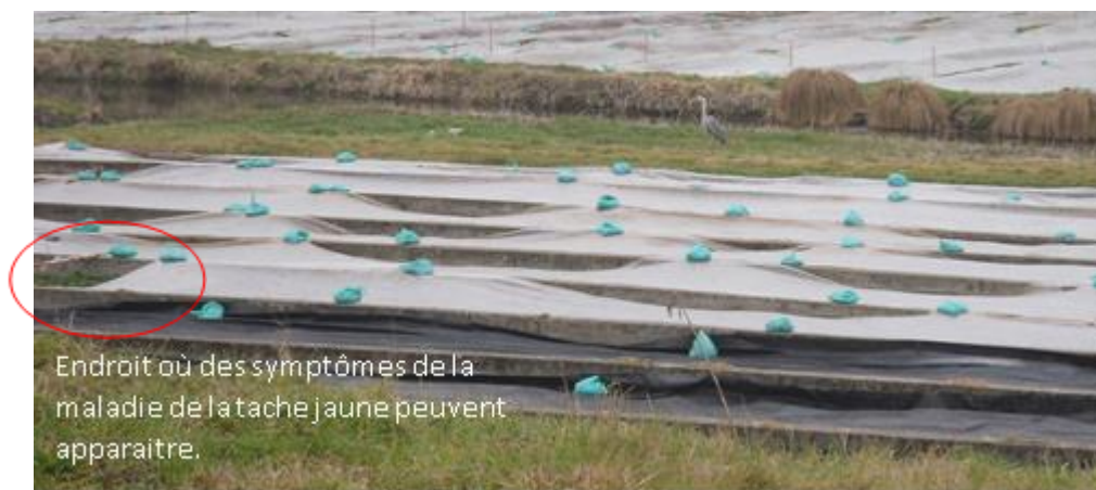
Endroit où des symptômes de la maladie de la tache jaune peuvent apparaître.