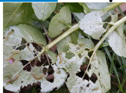
Larves de chironomes

En effet, en moyenne, 54% des pieds sont porteurs d'au moins une larve de chironomes dont 10% avec 4 à 7 larves et 7% avec plus de 8 larves par pied (voir le tableau ci-dessous)