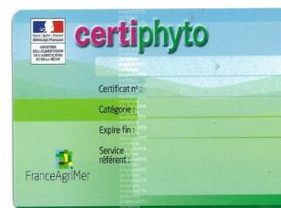
Figure 2 : la face verso du Certiphyto

Au 1 er octobre 2014, près de 800 000 personnes devront être certifiées.