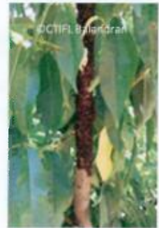
Colonie en « manchon »

Puceron de très grande taille : adulte environ 4,5 mm