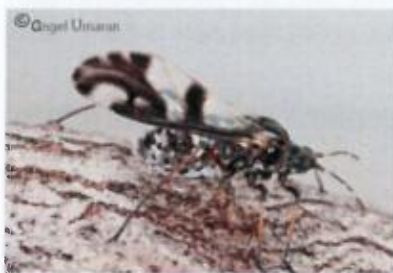
Adulte ailé avec des ailes très colorées