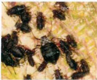
Aptère et larves

Pterochloroides persicae est un puceron (Hemiptera, Aphididae) qui vit en colonies sur les troncs et les branches des arbres fruitiers.