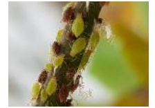
Cercle des horticulteurs IDF - CAR-IDF