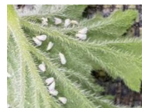
Cercle des horticulteurs IDF - CAR-IDF