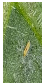
Cercle des horticulteurs IDF - CAR-IDF