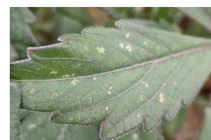
Cercle des horticulteurs IDF - CAR-IDF