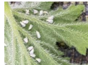
Cercle des horticulteurs IDF - CAR-IDF