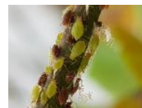
Cercle des horticulteurs IDF - CAR-IDF