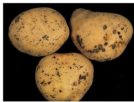
Symptômes de rhizoctone brun (Le Plant français)

Les principales sources d'inoculum sont le plant et le sol. En conditions froides et humides en début de cycle, la maladie peut entraîner des manques à la levée ou des levées irrégulières. Plus tard, un manchon de mycélium blanchâtre peut apparaître à la base de la tige, accompagné parfois de la formation de tubercules aériens à l'aisselle des feuilles. Sur les tubercules, des amas noirs appelés sclérotés sont visibles à la surface de l'épiderme.