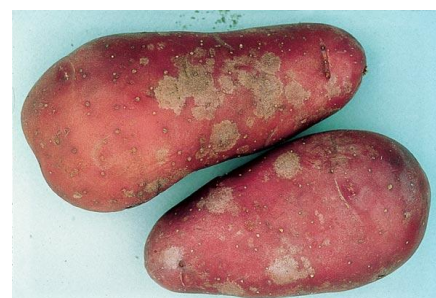
Symptômes de gale argentée (Le Plant français)

Ce champignon n'affecte que les tubercules ; aucun symptôme n'est visible sur le feuillage. Il se manifeste par des taches régulières de couleur gris argenté, parfois accompagnées de ponctuations noires. La maladie peut ne pas être visible à la récolte et se déclarer ultérieurement lors du stockage.