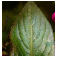
Cercle des horticulteurs IDF - CAR-IDF