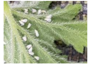
Cercle des horticulteurs IDF - CAR-IDF