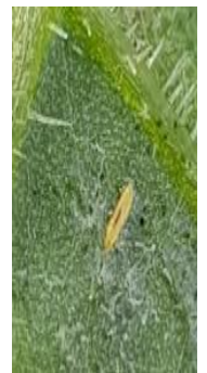
Thrips Frankliniella , Cercle des horticulteurs IDF - CAR-