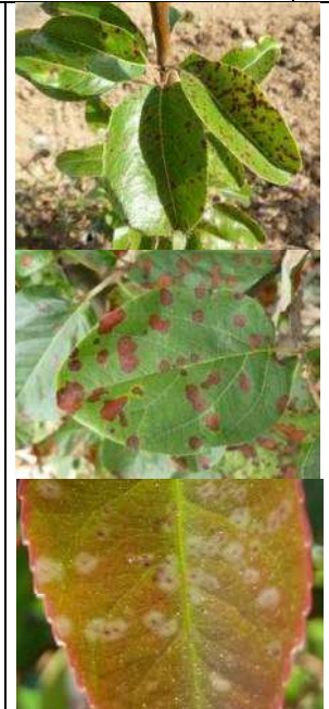
Entomosporiose sur poiriers et cognassiers et Photinia