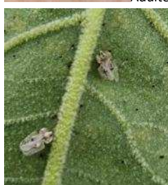
Tigre du Platane