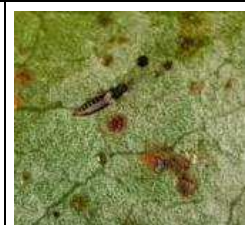
Heliethrips haemorrhoidalis sur V. tinus