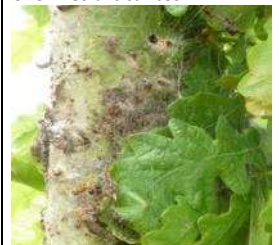
Nid avec tissage soyeux de protection