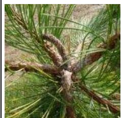
Dégâts sur pousses