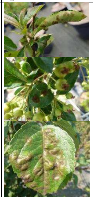
Tavelure sur Pyracantha , Malus

Il existe des produits de biocontrôle à base de laminarine, soufre, Bacillus subtilis , d'hydrogénocarbonate de potassium, de phosphonate de potassium.