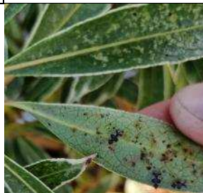
Dégâts sur feuilles de Pieris face > et face < avec présence d'adultes