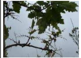
Dégâts sur feuilles

Attention il est déconseillé d'appliquer Bacillus thuringiensis sur chenilles à partir du stade L4. Trop âgées à ce stade les chenilles mettent plusieurs heures à mourir, larguent leurs poils dans l'air et tombent au sol ce qui contamine l'air et augmente les risques d'urtication.