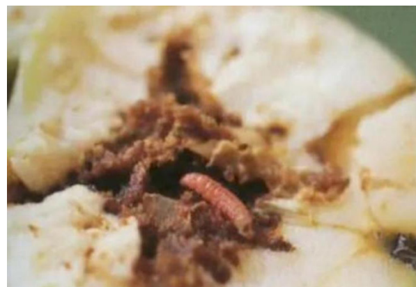
Dégâts de carposina