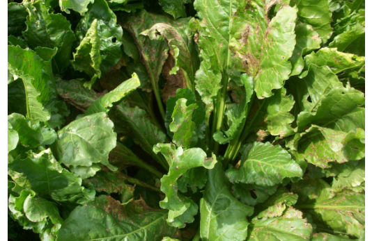
Une solution complémentaire à base de cuivre face aux résistances de la cercosporiose

- BOUILLIE BORDELAISE RSR DISPERS (cuivre) contre la rouille du figuier, avec 2 applications de 6,25 kg/ha maximum, jusqu'au 22/10/2023.