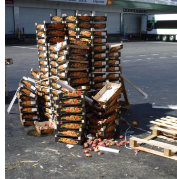
Attention à la gestion des déchets