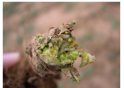
Dégâts de larves d'altises

Le 28 juin, les équipes régionales Terres Inovia de Normandie – Île-de-France et Hauts-de-France ont organisé un comité technique, en visio-conférence, consacré au bilan des actions du projet ADAPTACOL (adaptation du colza). Ce projet, piloté par l'institut technique, fait partie du plan d'action sortie du phosmet (2022-2025), destiné à trouver des solutions alternatives à cette substance active retirée l'an passé, pour lutter contre les ravageurs d'automne du colza (altises et charançon du bourgeon terminal). Dans la lettre de mars dernier, nous avons déjà présenté quelques une des thématiques testées au champ.