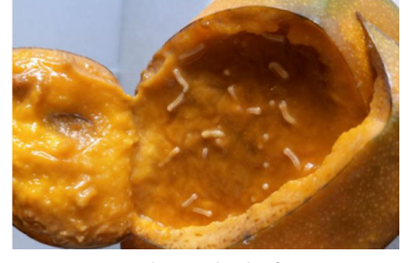
Larve de mouche des fruits

La deuxième famille est celle des Tephritidae , qui sont des mouches de la même taille environ qu'une mouche domestique. Ce sont principalement leurs couleurs et les motifs sur les ailes qui aident à déterminer les espèces. La femelle porte un appareil ovipositeur qu'elle utilise pour percer la chair de fruits, souvent en sur-maturité ou abimés, et y déposer un œuf. Celui-ci donne naissance à une larve qui trace des chemins dans le fruit à mesure qu'elle s'alimente pour grossir. Puis elle deviendra la mouche adulte qui peut voler et s'accoupler. Le fruit, blessé et à la proie des infections, va dépérir et tomber prématurément. Les larves apodes, de 6 à 10 mm, blanc-crème, ne présentent pas de capsule céphalique différenciée, et les stigmates postérieurs ne dépassent pas contrairement à Drosophila suzukii .