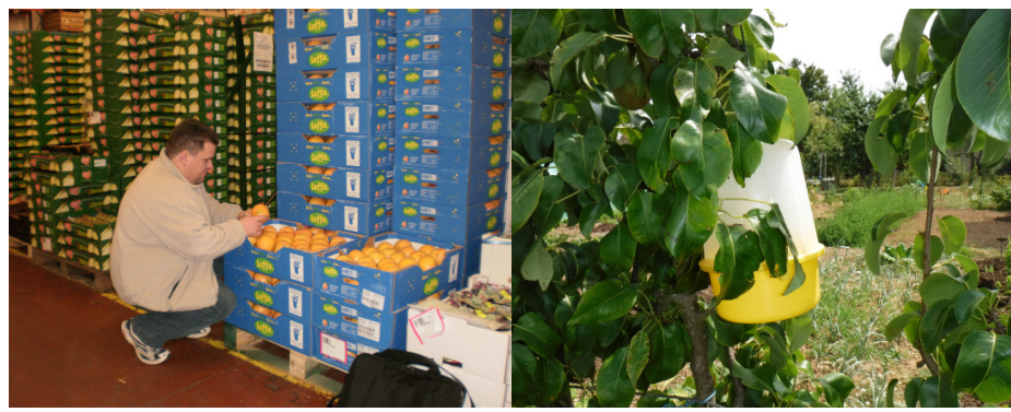
Contrôle de lots à l'import et réseau de piégeage : deux missions du SRAL

tiques augmente. A ce titre, elles sont classées comme organismes de quarantaine pour l'Union européenne, et font l'objet de contrôles ciblés sur les points d'entrée (comme Roissy et Orly) sur des produits végétaux les plus à risque comme les agrumes ou les fruits exotiques (mangue, goyave, etc.). Des interceptions sont faites régulièrement.