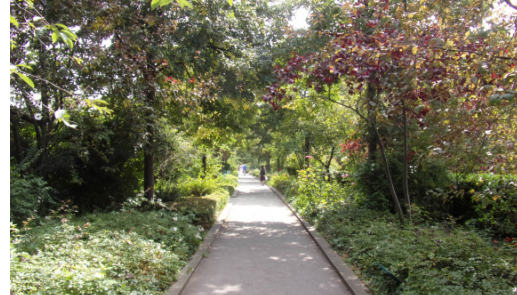
Des guides pour chaque type d'espace