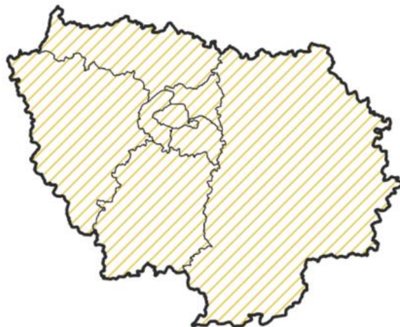
Carte du périmètre du PAEC « Surface des parcours extérieurs des élevages monogastriques »

Cette MAEC est accessible sur l'ensemble des communes de la région d'Île de France.