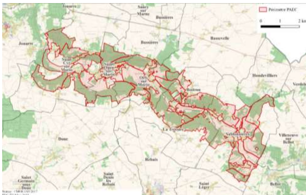
Carte du territoire « Petit Morin »

Les communes comprises dans le territoire du PAEC « Bassée-Morin » sont les suivantes :