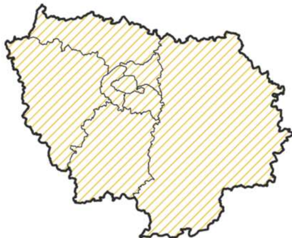
Carte du périmètre du PAEC « Surface des parcours extérieurs des élevages monogastriques »

Cette MAEC est accessible sur l'ensemble des communes de la région d'Île de France.