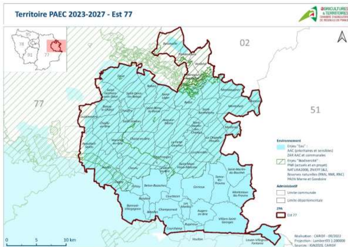
Figure 1 : Périmètre du territoire PAEC EST 77

Le périmètre du projet agro-environnemental et climatique (PAEC) « EST 77 » est représenté sur la figure 1. Il s'étend sur 52 communes.