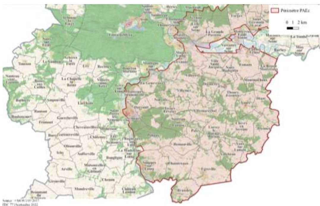
Carte n°4 : Communes du Bocage incluses dans le PAEC

Les communes comprises intégralement ou partiellement dans le territoire du PAEC sont présentées dans le tableau ci-dessous.