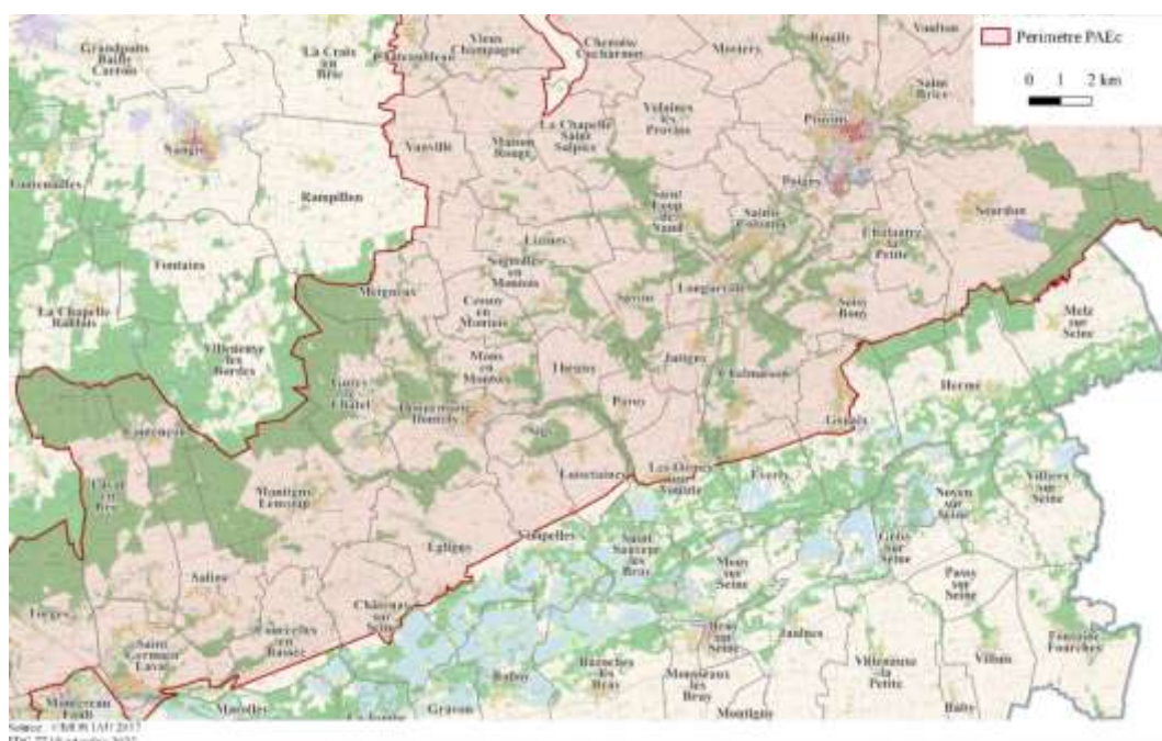
Carte n°3 : Communes du Montois incluses dans le PAEC