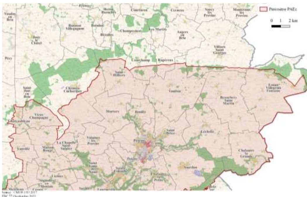
Carte n°2 : Communes de la partie Brie Est incluses dans le PAEC